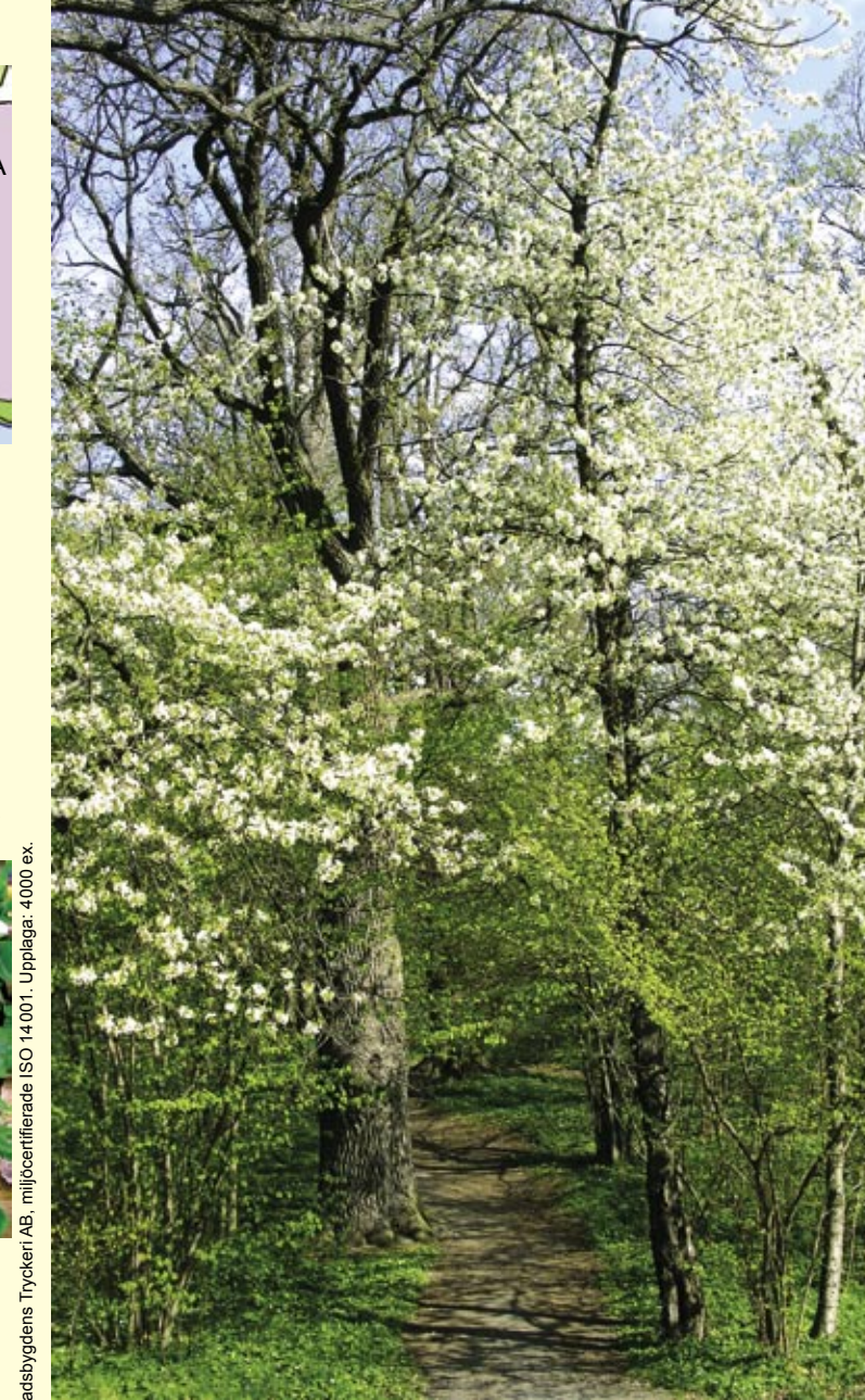
Kartmaterial Lidingö stad. Tryck: Sjuhäradabyggnads Tryckeri AB, miljöcertifierade ISO 14001. Upplag: 4000 ex.