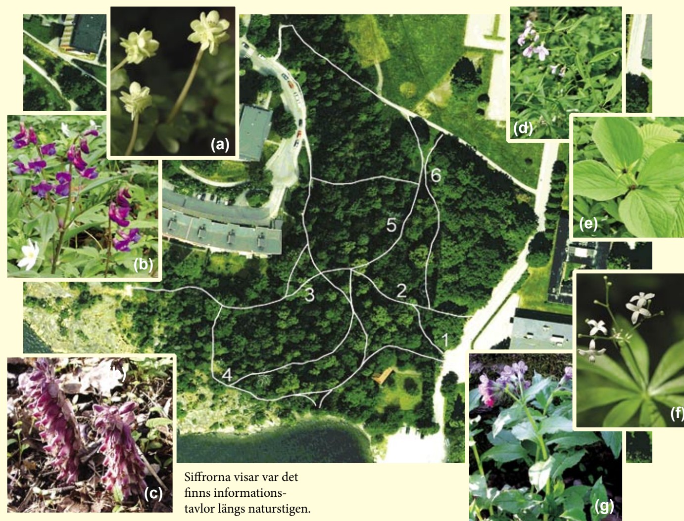
Siffrorna visar var det finns informationstavlorna längs naturstigen.

En lövskogslund kännetecknas av ett olikåldrigt skogsbestånd med enstaka grova ädellövträd exempelvis ek, alm, lind, bok och lönn. Buskskiktet är välutvecklat och flerskiktat och florin örtrik med en riklig blomning, särskilt på våren. Den rika lundfloran förutsätter vissa ljusbetingelser för att inte förändras. Ett ökat ljusinsläpp innebär att örterna konkurreras ut av ljuståliga gräs och andra växter. Marken är mullrik och mjuk och känslig för tramp och slitage, så håll dig därför till stigarna som genomkorsar området.